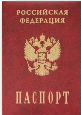
Копия паспорта (заявителя и родителей)