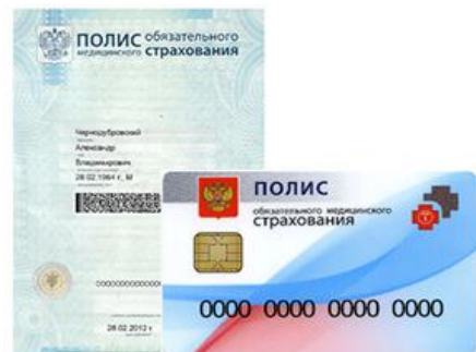
Копия медицинского полиса (2 копии)