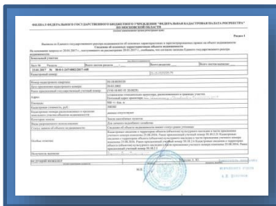
Выписка из ЕГРН (Единого государственного реестра недвижимости)