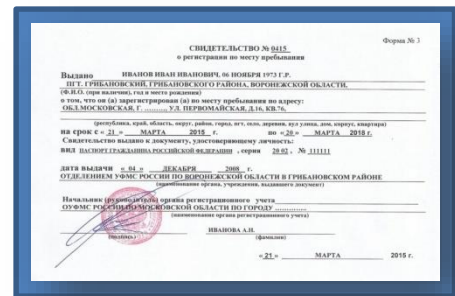
Свидетельство о регистрации по месту жительства