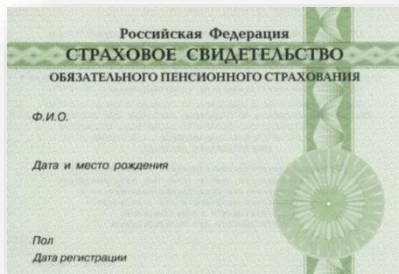
Копия СНИЛС (2 копии)